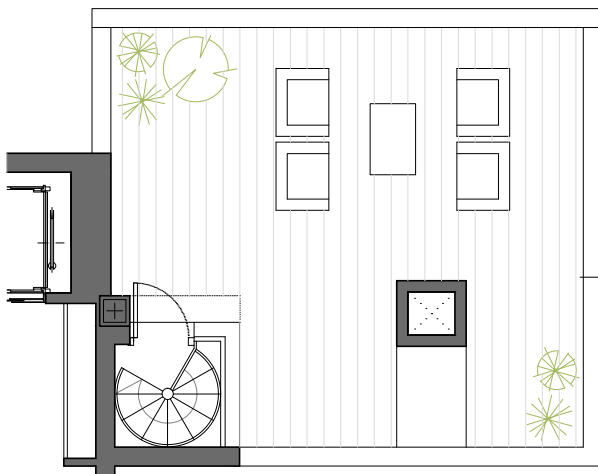
PLANTA DE CUBIERTAS