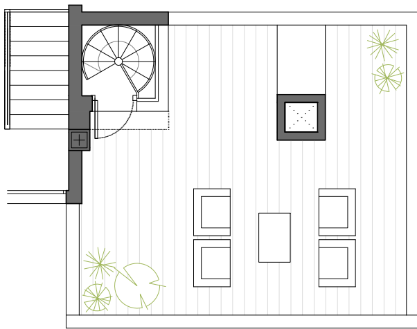
PLANTA DE CUBIERTAS